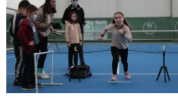
Türkiye Sportif Yetenek Taraması ve Spora Yönlendirme Programı başladı