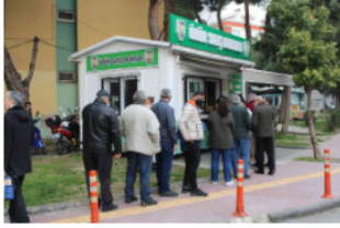
Aydınlı Vatandaşlar, TMO Ürün Satış Noktalarına Akin Etti 8 dakika önce