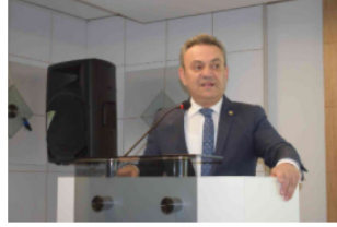
Samsun MMO'da Seçim Heyecanı 8 dakika önce