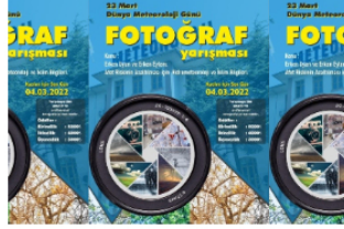
Meteoroloji Günü Fotoğraf Yarışması İle Kutlanacak 8 dakika önce