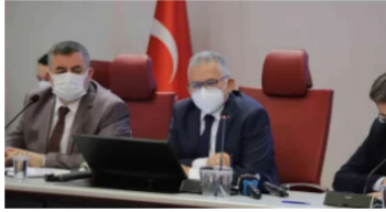
Besiciler ve üniversite öğrencilerinin su faturasına beledi...