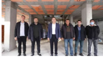
Cunda Adası'na hizmet binası