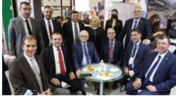
Burhaniye EMİTT'te fark attı